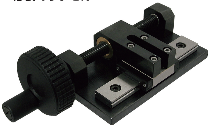
品番 : MTX-B001