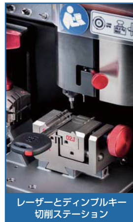
レーザーとディンプルキー切削ステーション