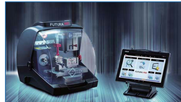
タブレットスタンドは装置の上部に取り付けられ、傾けられます。機械の横のベンチまたはテーブルに置くこともできます。

Silcalは、自社製品の品質のみならず独自のデザインにも誇りを持っています。FUTURA PRO本体はトータルブラック色。マシン上部のツールホルダーマット改良されたモーターを保護する光沢スチール製カバーなど独自でスタイリッシュなデザインです。