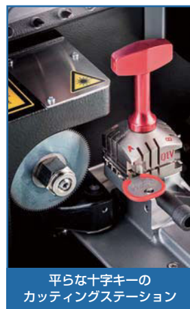
平らな十字キーのカッティングステーション

FUTURA PROは、取り外し可能な10インチAndroidタブレットで制御します。このタブレットは、オペレーターに鍵の切削方法を順を追って教えてくれます。(たとえば自動車メーカー・車種・年式からの検索を使用するクランプの選択など) また、Silca Softwareの主な機能とデータが統合されており、広範囲なロックメーカーのカードデータや自動車用のキーコード表が内蔵されています。