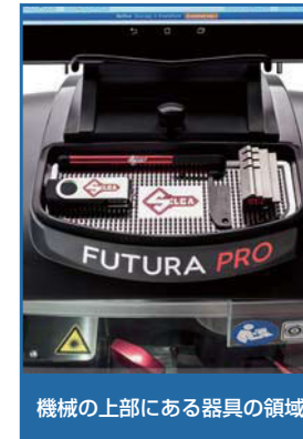
機械の上部にある器具の領域

CE FUTURA PROは、CEマーク欧州規格に則って設計・生産されています。